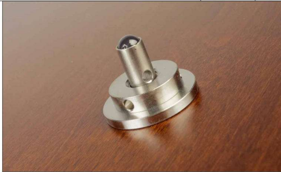
Mittlerweile koppeln Keramik-Kugeln die Einlegeböden an den Unterbau an

Der Wabenkern sorgt für ein deutlich verbessertes Resonanzverhalten und