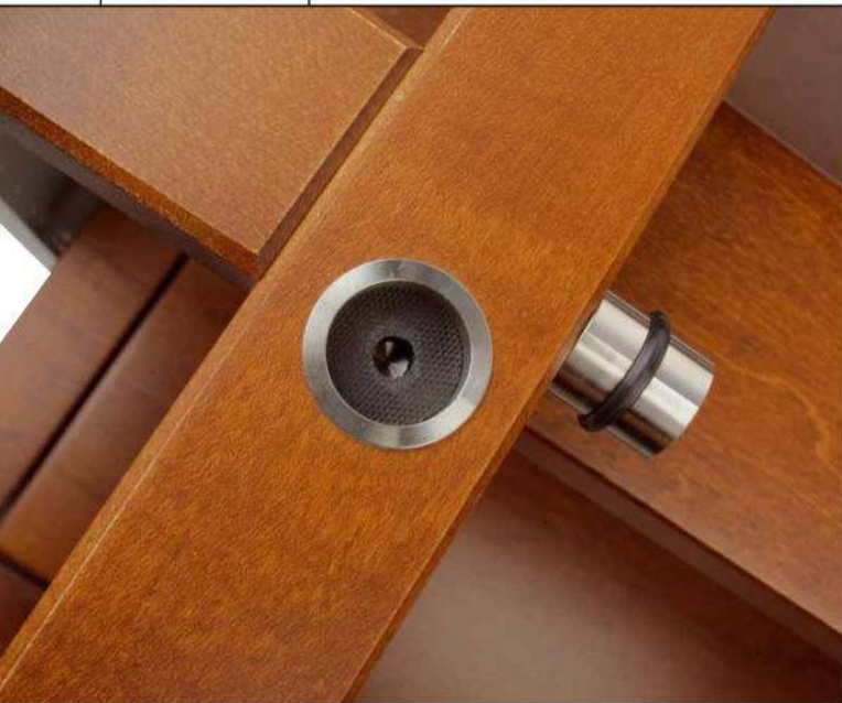
Moosgummiringe halten die Rackböden an Ort und Stelle