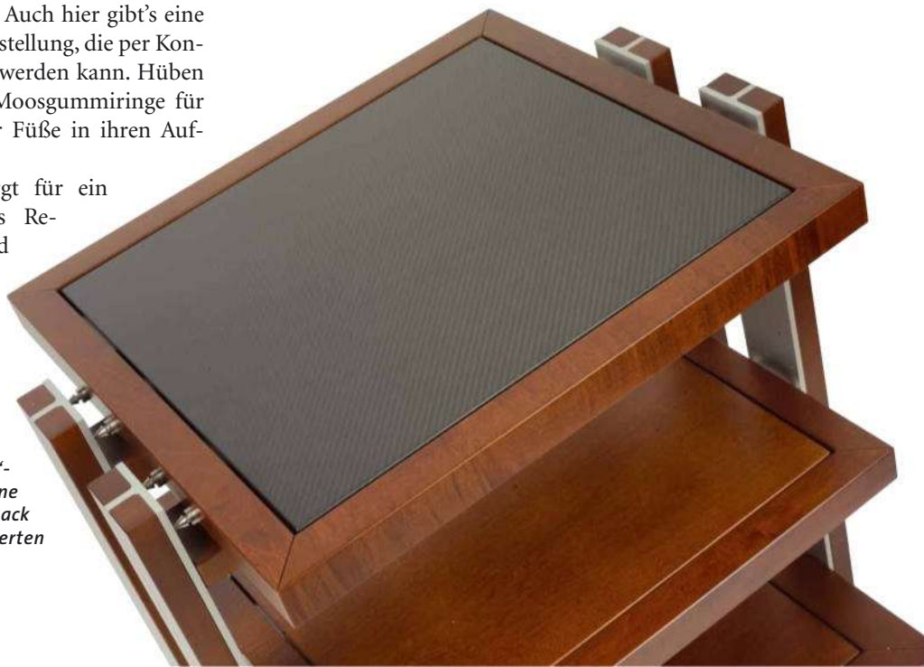
Die „Carbofibre“- Böden sind eine Möglichkeit, das Rack noch weiter aufzuwerten

Eine der Schlüsseltechnologien bei den Finite Elemente-Racks ist die trickreiche Resonantortechnologie, die etwaige Schwingneigungen der Geräte unterdrücken. Dabei handelt es sich um Massedämpfer, die an der Innenseite der Tragrahmen montiert werden. Ihre Abstimmung wurde mit der MKII-Version des Racks geändert, die neuen Böden machten eine Anpassung an dieser Stelle unabdingbar. Übrigens ist es nicht egal, welche der Stellflächen an welcher Position im Rack zum Einsatz kommt. Deshalb sind sowohl Ausrichtung als auch „Etagé“ bei jedem Boden markiert.