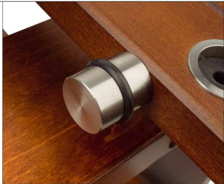
Die Resonatoren kompensieren die Schwingungen der auf dem Rack stehenden Geräte