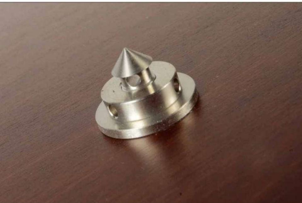
Darauf ruhten früher die Einlegeböden des Pagode-Racks

Ein über die Generationen gleich gebliebenes Merkmal der MKII-Pagode sind die Rahmenkonstruktionen aus solidem kanadischen Ahorn, die die Aufnahme für die eigentlichen Geräteböden bilden. An dieser Stelle gab's nichts zu verbessern, die Kombination aus Festigkeit und Formstabilität machen das Material zur ersten Wahl an dieser Stelle.