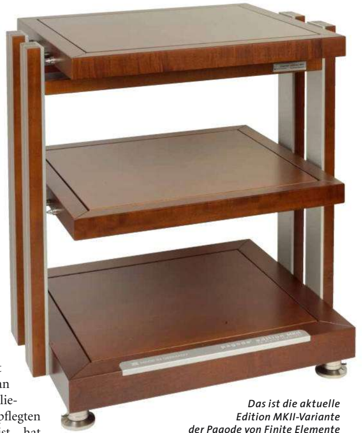
Das ist die aktuelle Edition MKII-Variante der Pagode von Finite Elemente

Zur Beantwortung dieser Frage rückten die Herren von Finite Elemente mit zwei Modellen an, die sich auf den ersten Blick nur dadurch unterschieden, dass eines da-